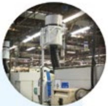
100 Geräte von Filtermist im Powertrain-Werk von Nissan in Barcelona